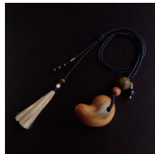
屋久杉 & 富士溶岩