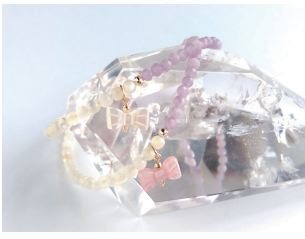
9月の新しい誕生石 クワンザイト & マザーオブパール