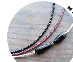
ルビー & ガーネット