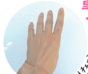
天然ジルコン & Goldチェーン