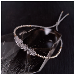
ダブルポイントクリスタル ↑ブレス ↓ネックレス