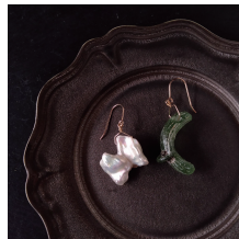
ロマンガラス & 大粒クワンパル