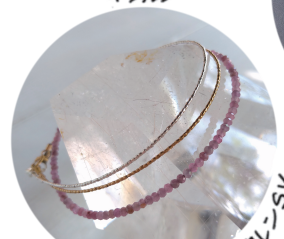
ピンクサファイア & カレンSV