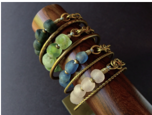
アフリカンビーズ & BRASS