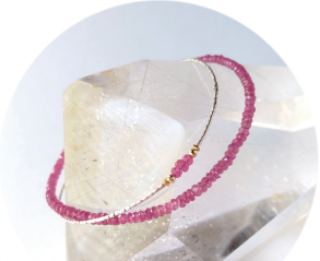
宝石の女王ルビー