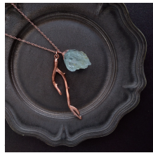
アクアマリン & ウミウチワ