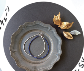
ラピスラズリ & カレンSV