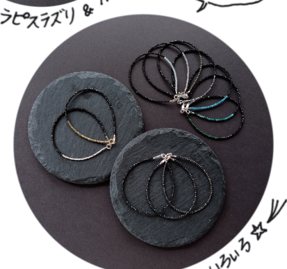
スピネル いろいろ☆