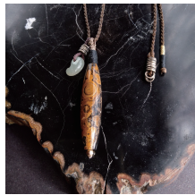
蒙天珠 & 糸魚川翡翠