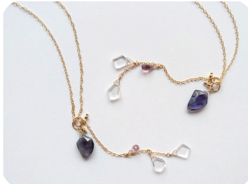
マイオライト 4way ネックレス 使いいろいろ楽しめます!