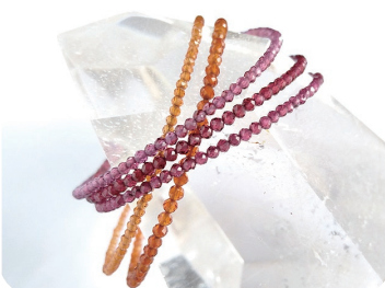
ガーネット ブレス 同じ石でもいろんなカラーがあるんですよ

新しく制作したアクセサリたち。♡ インスタやFBにも出来たてほやほやをUP中 よかったらご覗きになって下さいね♡