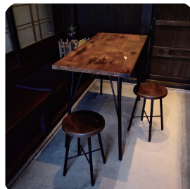
テーブル&スツール

カヌー古材のパンキが残っている 感じもカワイイ。 フェルミナータの文字やマークは 手掘りで仕上げてもらいました!