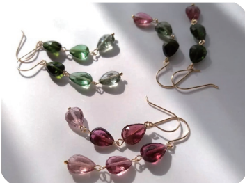
トルマリンピアス 3色ご用意 どの色が好きですか?